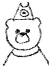
Правоохранительная деятельность и оборона страны