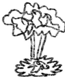
Озеленение территории и охрана природы