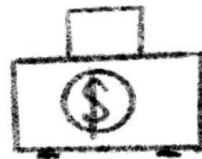
Покрытие государственного долга и др.